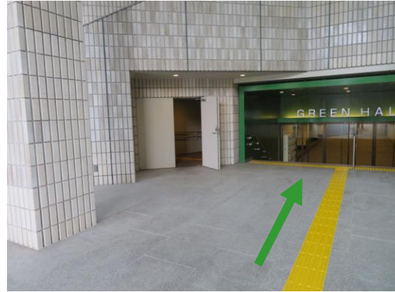
(正面奥) グリーンホール